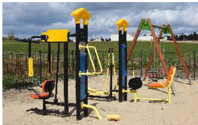
Plac zabaw z siłownią zewnętrzną w Bukowie