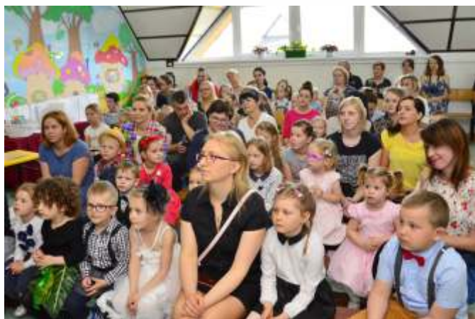
Zasłuchani uczestnicy konkursu wraz z rodzicami i opiekunami

Dnia 26 kwietnia 2019 roku odbył się w Szkole Podstawowej w Mojuszu II Gminny Konkurs Recytatorski Wierszy Juliana Tuwima i Jana Brzechwy dla dzieci w wieku przedszkolnym, na który przybyły tłumnie dzieci z placówek przedszkolnych i szkół z terenu Gminy Sierakowice oraz ich rodzice i opiekunowie.