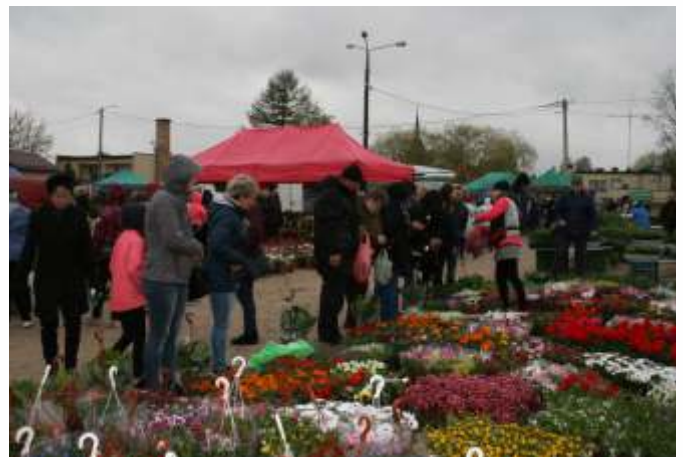
Tekst i foto: AK

Mimo niesprzyjającej pogody i zmiany terminu tegoroczne Święto Kwiatów i Krzewów można uznać za udane. 2 maja, a nie jak w poprzednich latach, 1 maja, już od rana gminne targowisko w Sierakowicach wypełniło się sprzedawcami oferującymi szeroki asortyment roślin ogrodowych: drzewek oraz krzewów owocowych i ozdobnych, sadzonek kwiatów, rozsady warzyw, a także nasion i cebulek. W sprzedaży dostępne były też elementy dekoracji ogrodu. Zapaleni ogrodnicy-amatorzy mieli w czym wybierać, a tegoroczne Święto Kwiatów i Krzewów było doskonałą okazją do zaopatrzenia się w roślinność do nowych nasadzeń w ogrodach i na balkonach.