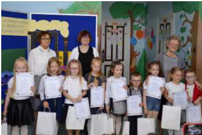
Laureaci kategorii 5 i 6-latków wraz z komisją.