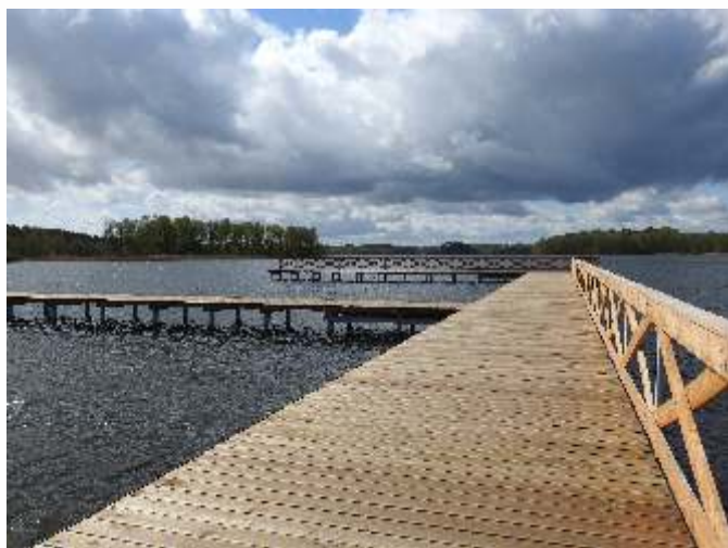
Jeden z dwóch pomostów

Zrealizowano część inwestycji w infrastrukturze dla żeglarzy, kajakarzy i wypoczywających nad Jeziorem Gowidlińskim. Na północnym brzegu akwenu wybudowano przystań żeglarsko-kajakową z dwoma pomostami, kąpieliskiem i polem biwakowym z miejscem na ognisko, wiatami i ławostołami.