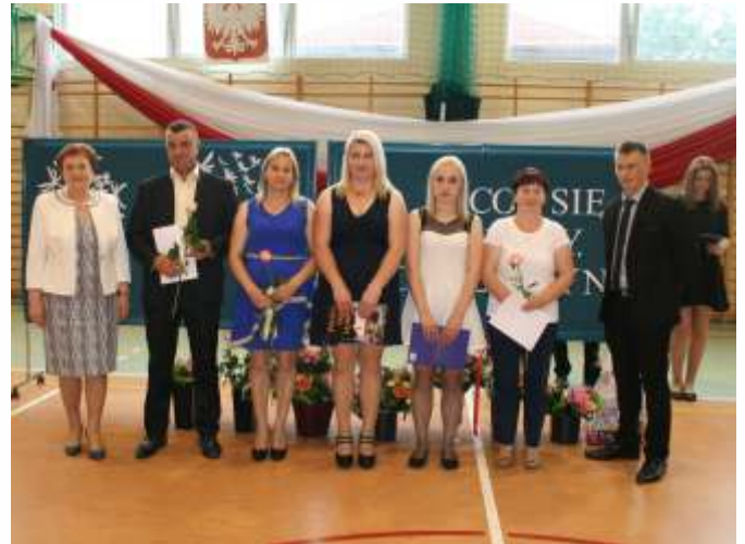
Wyróżnione absolwentki kl. III b z rodzicami i pracodawcami