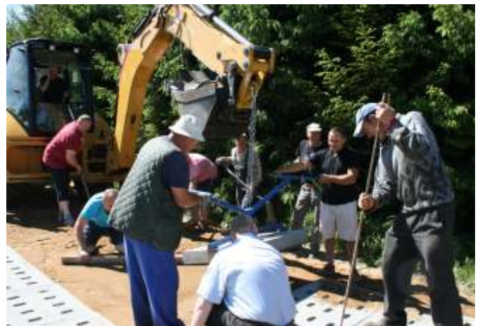
Mieszkańcy osiedla przy pracy

Fachowo położone płyty, ze zjazdami dla swobodnego mijania samochodów i innych pojazdów, znacznie poprawiły