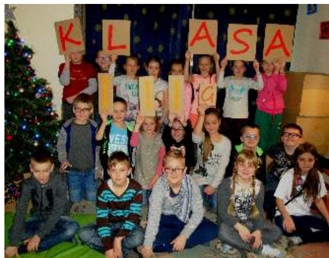
Klasa III g z SP w Sierakowicach