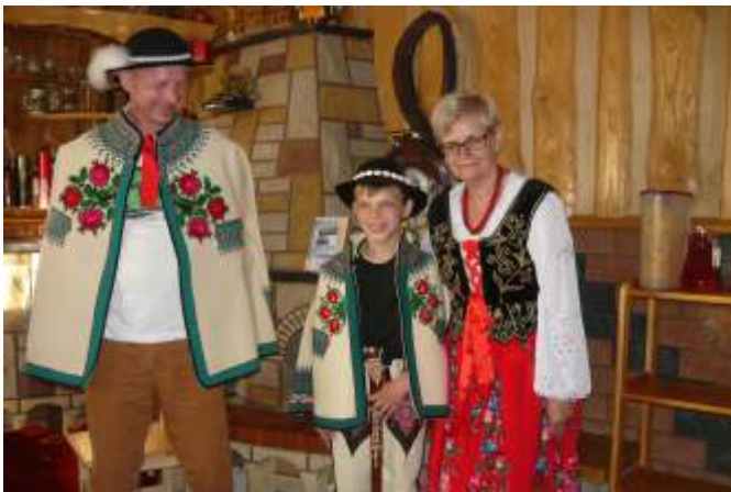
Prawda, że nasi też ładnie wyglądają w góralskich strojach?

Popołudnie było relaksem u zaprzyjaźnionej grupy z Jelonka (która mieszkała w sąsiedniej bazie), czyli grill i zabawy na placu zabaw. Niedziela była tym dniem, kiedy mieliśmy zakosztować trudów prawdziwej wspinaczki. Wjechaliśmy koleją linową na Kasprowy Wierch. Niezapomniane widoki, zwłaszcza że pogoda dopisała i widoczność była fantastyczna. Można się było przekonać, iż zima w górach jeszcze nie odpuściła i miejscami trzeba było przeprawiać się po śniegu. Ze szczytu Kasprowego powędrowaliśmy szlakami turystycznymi, odpoczywając co jakiś czas. Okazało się, że „dajemy radę”, dlatego pani przewodnik poprowadziła nas nieco dłuższą trasą. Tak zdobyliśmy szczyt Beskidu. To dopiero było przeżycie, zdobyty na własnych nogach szczyt! Na dół zjechaliśmy koleją linową, potem chwila relaksu na lodach i już byliśmy gotowi na dalsze wrażenia. Odwiedziliśmy Pustelnię Świętego Brata Alberta, gdzie zapoznaliśmy się z życiem tego niezwykłego człowieka i zobaczyliśmy pamiątki po nim. Pojechaliśmy też do Sanktuarium Matki Bożej Fatimskiej na zakopiańskich Krzeptówkach.