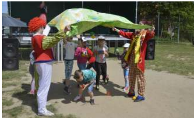
Jeden z wielu konkursów z udziałem dzieci

Nasz Festyn był wspaniałą okazją do spotkań sąsiedzkich, koleżeńskich, do miłego spędzenia czasu, dlatego wśród gości pojawił się główny sponsor imprezy – Wójt Gminy,