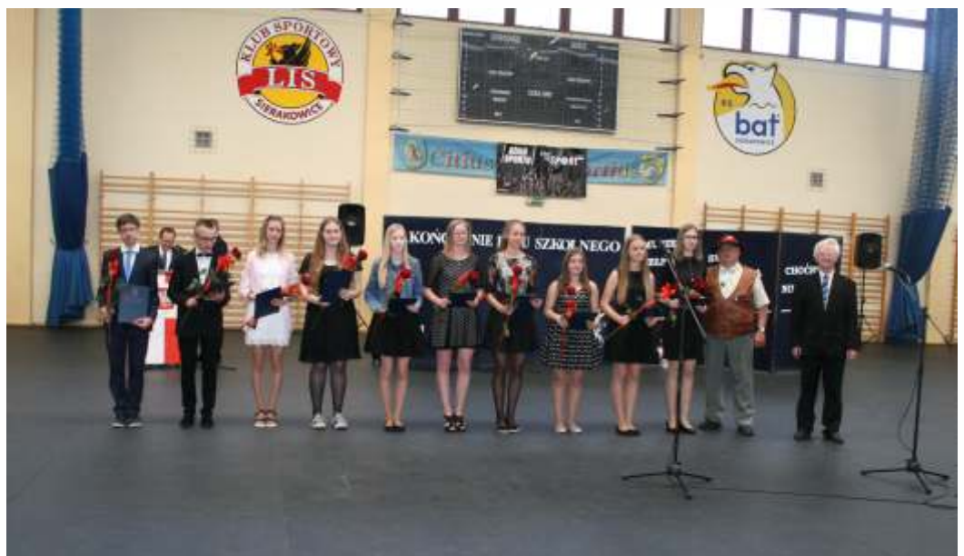
Nagrodzeni absolwenci gimnazjum w Sierakowicach