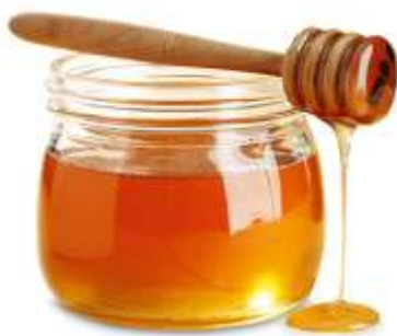
Miód gotowy do spożycia

O doskonałych właściwościach produktów pszczelich nie trzeba dzisiaj chyba nikogo przekonywać. Wśród skarbów z pasieki znajduje się kilka „wyrobów” pszczół, a mianowicie: miód, pyłek kwiatowy, pierzga, propolis (kit pszczeli), mleczko pszczele i wosk. Na niektóre z nich chciałbym zwrócić uwagę.