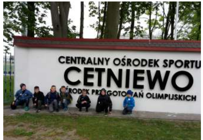
W miejscu przygotowań sportowej kadry narodowej

Drugie spotkanie miało miejsce w 2016 roku w Grodzie Wejhera (do którego zmierzał z pielgrzymką literacki bohater Remus). Uczniowie przeszli podczas tego projektu całe miasto, odwiedzili wszystkie kaszubskie zakątki: najstarszą na Kaszu-