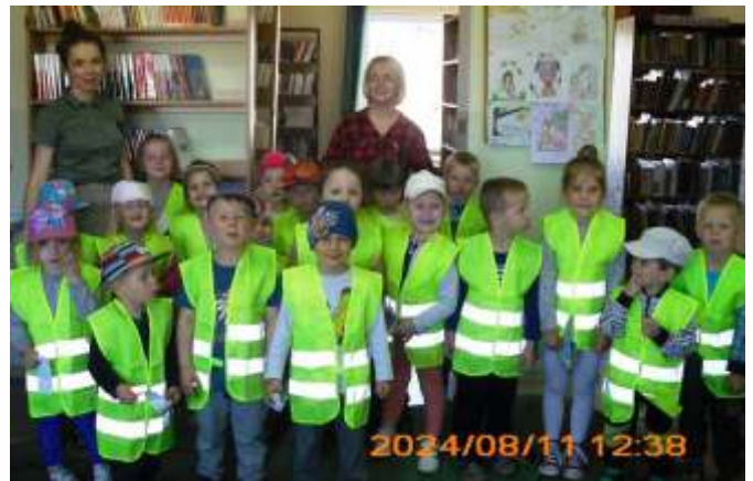
Przedkolaki na spotkaniu w bibliotece