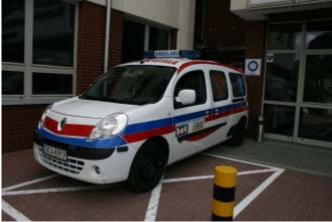
Ambulans transportowy zakupiony przez właścicieli firmy BAT i ELWOZ

W 2008 r. został zakupiony sterylizator, bez którego przychodnia nie mogłaby funkcjonować. Wcześniejszy model urządzenia służył w ówczesnym ośrodku zdrowia przez prawie 40 lat. Sterylizator był stary, wyeksploatowany i brakowało do niego części zamiennych, więc awaria uniemożliwiłaby sterylizację narzędzi medycznych i opatrunków, a w konsekwencji prawidłowe funkcjonowanie przychodni. Dzięki hojności prezesów Firmy Handlowej BAT, zakup urządzenia stał się faktem.