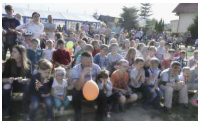
Licznie zgromadzeni goście