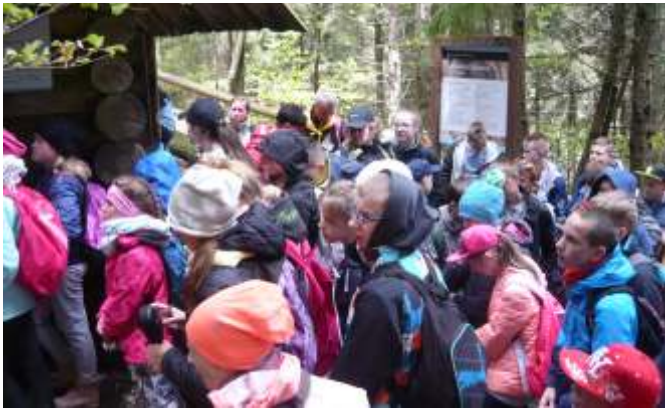
Wchodzimy do Jaskini Mroźnej

Uczniowie Szkoły Podstawowej w Mojuszu uczący się języka kaszubskiego poznają nie tylko Kaszuby, ale również inne wyraziste kulturowo regiony. W bieżącym roku szkolnym celem wyprawy było przybliżenie realiów kultury podhalańskiej. Na spotkanie z Góralami umówiliśmy się już w marcu, kiedy przedstawiciele Związku Podhalańców gościli na Kaszubach z okazji obchodów Dnia Jedności Kaszubów w Chmielnie. W dniach 25-30 maja uczniowie Szkoły Podstawowej w Mojuszu i w Jelonku wyjechali autokarem na 6-dniową wycieczkę i warsztaty regionalne w Tatry. Przed dojazdem do celu