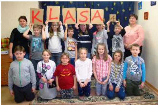
Uczniowie kl. IV z Kamienicy Królewskiej

Przypominamy o ofercie dotyczącej zajęć czytelniczych dla przedszkolaki i szkół podstawowych. Szczegółowe informacje znajdują się na stronie biblioteki w zakładce: DLA DZIECI – ZAJĘCIA CZYTELNICZE.