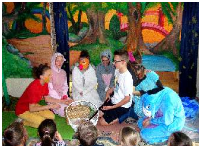
Grupa Teatralna Miotła – przedstawienie „Kubuś Puchatek”