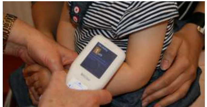
Bilirubinometr do bezinwazyjnego oznaczenia poziomu bilirubiny we krwi noworodków

Właściciele Firmy Handlowej BAT co roku z własnej inicjatywy przekazują pewną kwotę na potrzeby naszej gminnej przychodni.