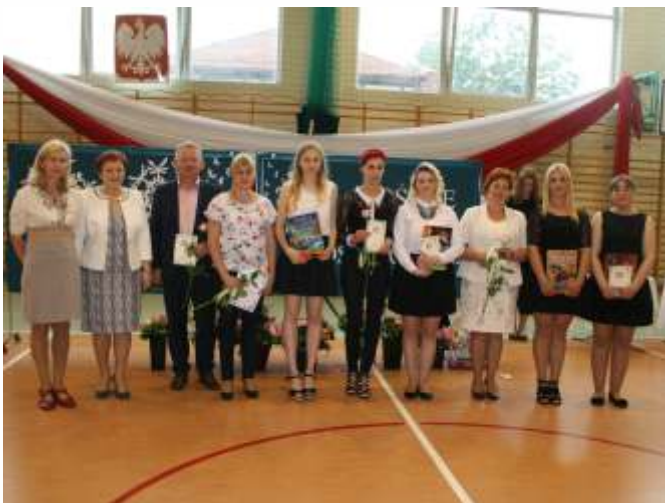
Wyróżnione absolwentki kl. III a z rodzicami i pracodawcami