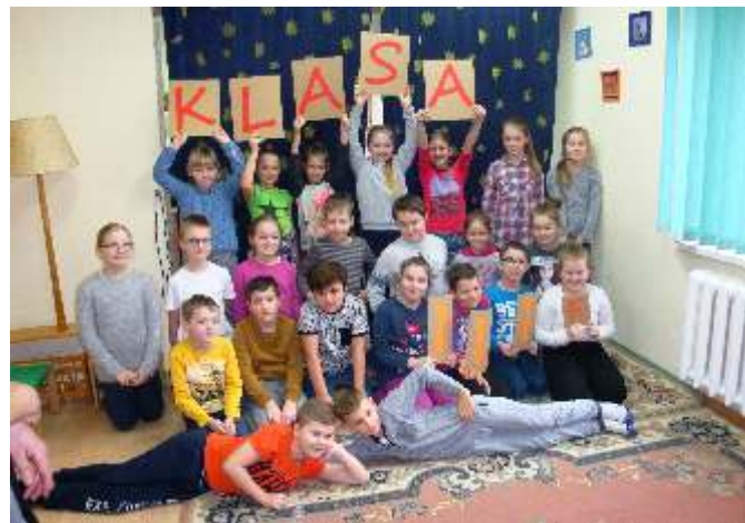
Klasa III f z SP w Sierakowicach

Biblioteka Publiczna zorganizowała w okresie od stycznia do maja cykl zajęć czytelniczych w ramach współpracy z gminnymi placówkami oświatowymi. W zajęciach wzięli udział uczniowie z Sierakowic, Załakowa, Kamienicy Królewskiej i Łyśniewa. Do grona uczestników dołączyły przedszkolaki z Samorządowego Przedszkola w Sierakowicach oraz dzieci z Przedszkola Nibylandia. Fotorelacje z zajęć można oglądać na stronie biblioteki www.bibliotekasierakowice.pl w zakładce DLA DZIECI – GALERIA ZDJĘĆ.