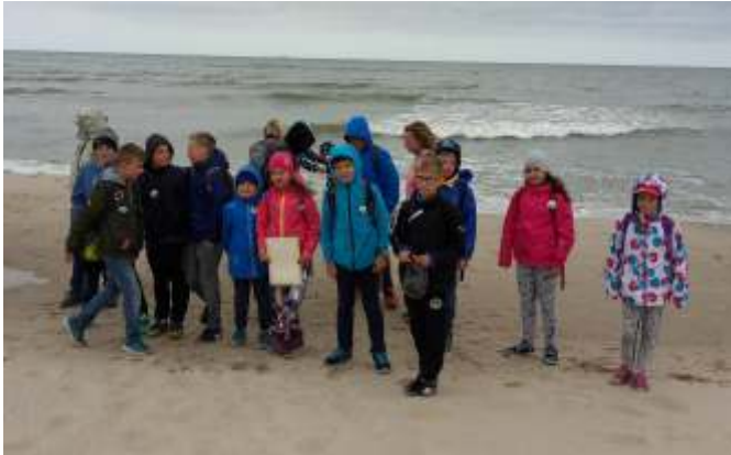
Z kartą zadań na brzegu morza

Uczniowie pobierający naukę języka kaszubskiego mają do dyspozycji różne pozaszkolne formy wglębiania się i poznawania tajników kultury kaszubskiej. Temu celowi jest też między innymi podporządkowany projekt edukacyjny „Wanoga literacka”, organizowany corocznie (w bieżącym roku po raz trzeci) w innym zakątku Kaszub.