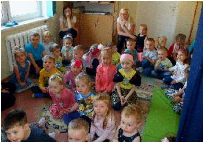
Przedkolaki z Nibylandii