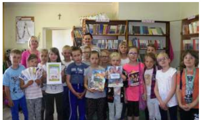
Klasa III z Tuchlina