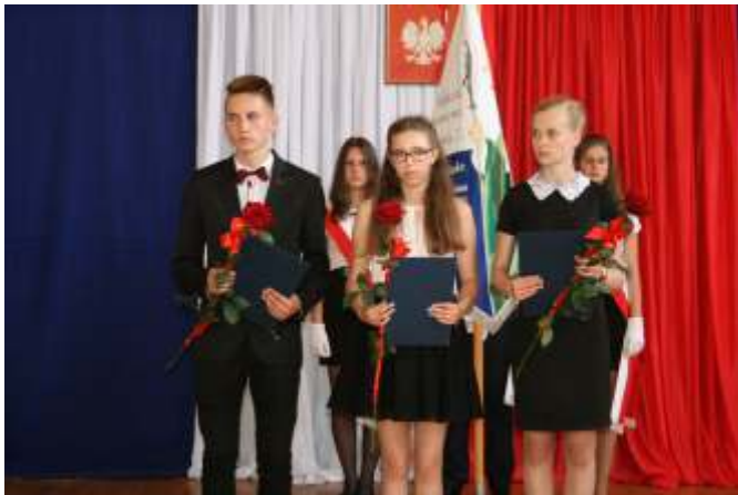
Najlepsi absolwenci gimnazjum w Gowidlinie

Podstawowym kryterium przyznawania nagrody są wyniki dydaktyczne: średnia ocen na świadectwie powyżej 5,0 oraz wzorowe zachowanie. Znaczące w ocenie jest także podkreślenie kaszubskiego patriotyzmu absolwentów.