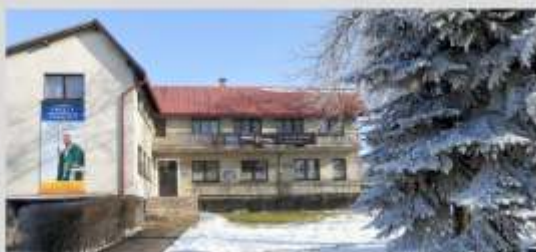
Wydział Służba Bezpieczeństwa Pożarników Włóchowskich w Sierakowicach. Str. 180 (półgłosz)