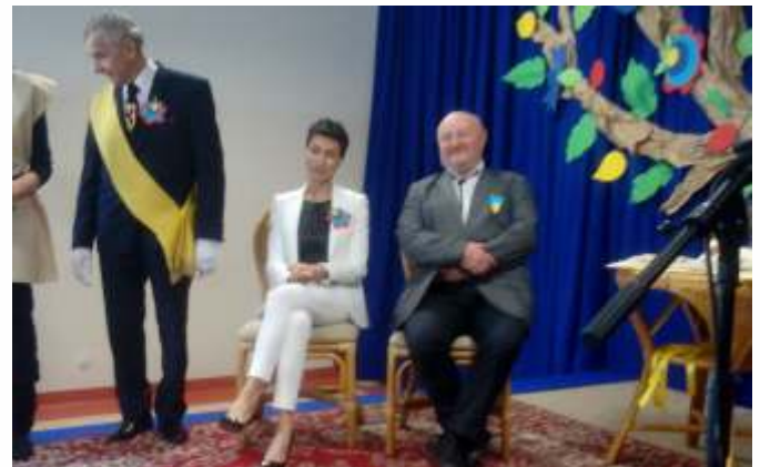
Laureaci wyróżnienia przed wręczeniem Ryngrafów

Tradycją wręczenia nagród jest spotkanie laureatów z uczniami. Przedstawiciele Szkoły Podstawowej w Mojuszu, uczący się języka kaszubskiego, skwapliwie skorzystali z tego niesamowitego zaszczytu, jakim było spotkanie z wybitną aktorką sceny polskiej Danutą Stenką, która w swoim niezwykle absorbującym zawodzie nie zapomina nigdy o tym, skąd jest i doskonale promuje kaszubszczyznę poza granicami Kaszub.