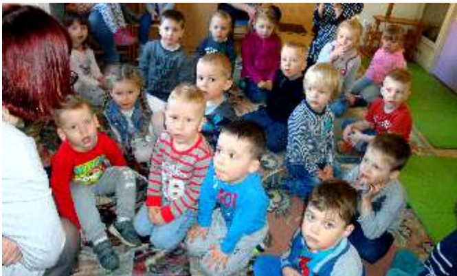
Przedkolaki z Samorządowego Przedszkola

Przypominamy o ofercie dotyczącej zajęć czytelniczych dla przedszkolaki i szkół podstawowych. Szczegółowe informacje znajdują się na stronie biblioteki w zakładce: DLA DZIECI – ZAJĘCIA CZYTELNICZE.