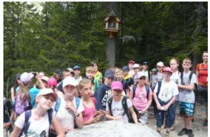
Przy kapliczce szczęśliwych powrotów

Kolejny dzień rozpoczęliśmy wizytą w baczówce, gdzie dowiedzieliśmy się wszystkiego o produkcji oscypków. Baca przedstawił cały proces produkcji popularnego produktu regionalnego, zademonstrował kolejne czynności, a my dodaliśmy do swego słownika kilka nowych wyrazów: np. bundz, żyntyca. Czy wiecie, co to? Bo my już wiemy. Potem cieszyliśmy się wjazdem wyciągiem krzeselkowym „Szymoszkowa” i odbyliśmy przyjemny spacer po Gubałówce. Znajdują się tam stragany, punkty gastronomiczne, gdzie uczniowie mogli kupić pamiątki dla swoich bliskich oraz spróbować lokalnych specjałów (królowały oscypki). Niesamowite, jak Górale umieją dbać