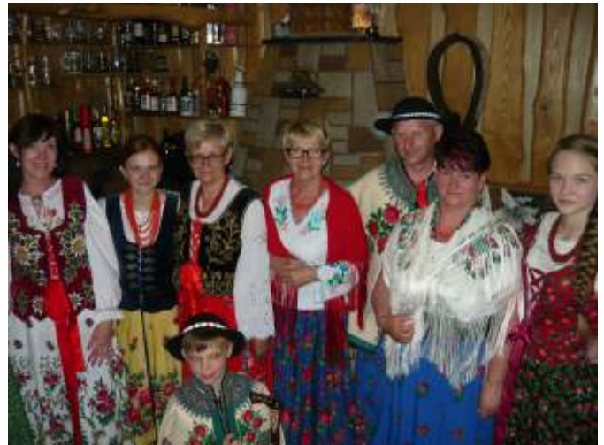
Kaszubi i Górale – wszyscy po góralsku

Wycieczka była bardzo udana, mogliśmy dowiedzieć się ekawych rzeczy, podziwiać przepiękne widoki. Choć czasami kipiało od emocji, to cieszyliśmy się z każdej chwili spędzonej razem. Dzięki staraniom Dyrektorów obu szkół i pomocy