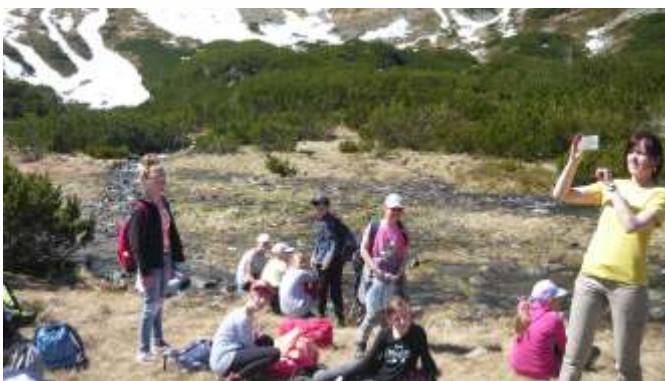
Odpoczynek na szlaku

Następnego dnia po śniadaniu wybraliśmy się do Jaskini Mroźnej. Po drodze obserwowaliśmy baców i juhasów wypasających owce na halach. Tu dowiedzieliśmy się, że Góral – gospodarz, przyjmujący gości w swoim domu – to nie baca, ale gazda, a jego żona – gaździna. Baca ma związek z hodowlą owiec, a chatka na hali, w której przetwarza mleko z udoju owiec – to