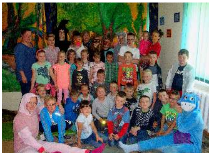
Dzieci z SP w Łyśniewie na przedstawieniu