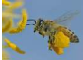
Pszczoła z zapelnionymi koszykami

mlekowy, cytrynowy, winowy, szczawiowy, bursztynowy i wiele innych.