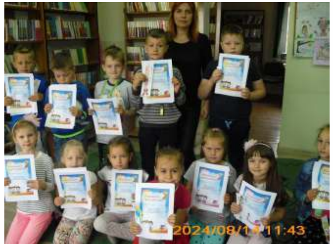
Klasa I z Gowidlina