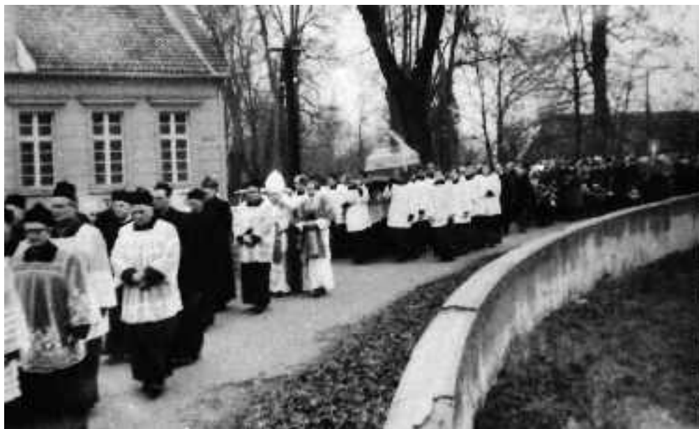
Pogrzeb ks. Sychty 29 listopada 1982 r. w Pelplinie

S.S.: Zapewne się uzupełniali. Ciocia była duszą. Gdy On miał jakiś pomysł, Ona utwierdzała Go w nim. Wszystko z nią konsultował.