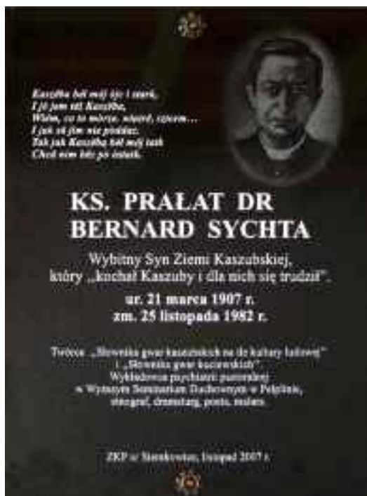
Pamiątkowa tablica w kaplicy Łaszewskich