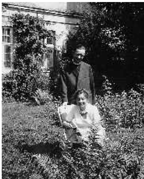
W Pelplinie w 1970 roku