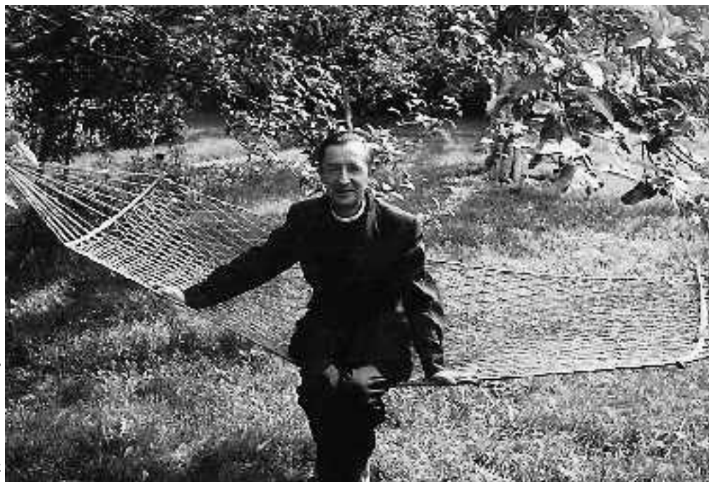
W Pelplinie w 1970 roku

karykatur; obdarowywał nimi ludzi, z którymi przychodziło mu wspólnie spędzać czas.