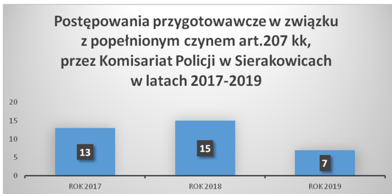
Wykres nr 2

Wykres nr 2 obrazuje ilość prowadzonych postępowań przygotowawczych w związku z popełnionym czynem art.207 kk.